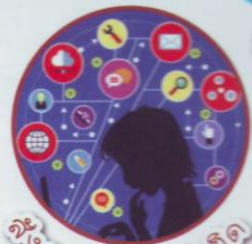
สังคมและยาเสพติด