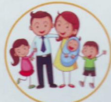
ครอบครัว

ทุลกระหม่อมหญิงอุบลรัตนราชกัญญา สิริวัฒนาพรรณวดี องค์ประธานโครงการ TO BE NUMBER ONE