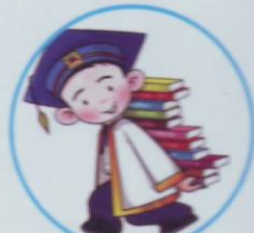
การเรียนรู้