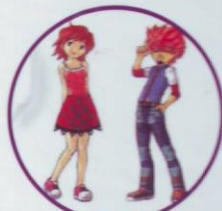
บุคลิกภาพ